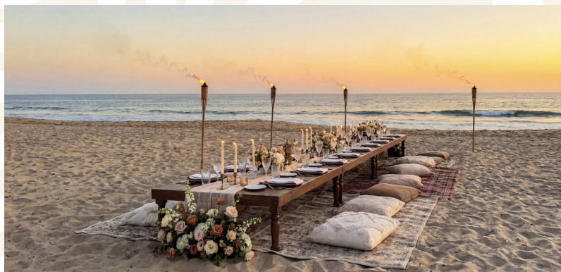
Experiencias únicas a la orilla del mar