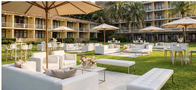
Hermosos y amplios jardines