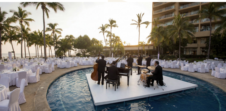
Espacios exteriores multimodales