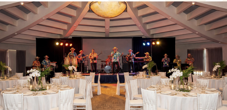
Elegantes y versátiles salones